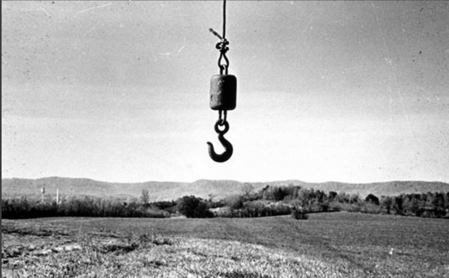
Thomas Merton, The Sky Hook

On opeteltava ensin katselemaan sitä, mikä on tavallista